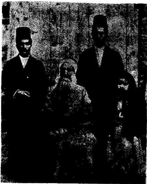
میرزا یحییٰ صبح ازل، مدّعی جانشینی باب